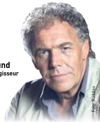
Christian Kohlund Schauspieler und Regisseur